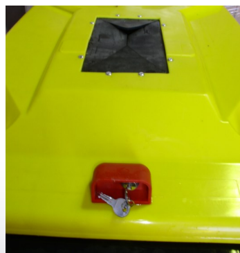
Serrure gravitaire à clé plate montée sur bac