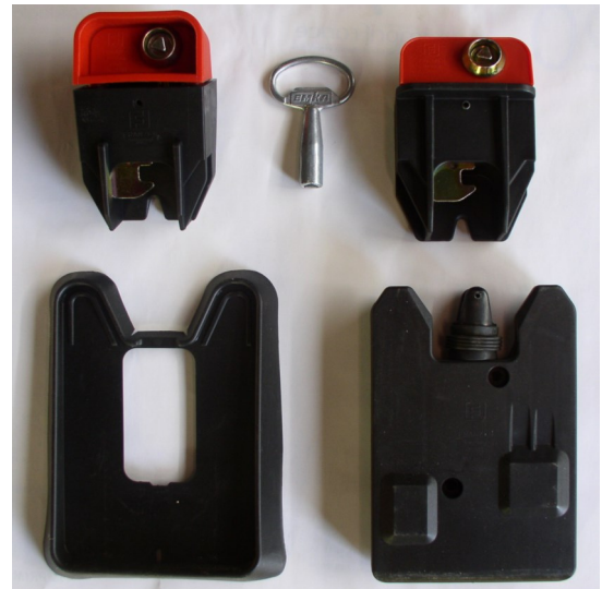
Serrures gravitaires bac 4 roues et bac 2 roues avec :

Sur demande il est possible de fournir une dizaine de jeux différents (clés plates).