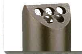
LIPSTICK I et II

"CLASSIC" - ligne sobre cette colonne avec pictogramme se fixe au sol grâce à une plaque métallique renforcée Dim : 14 x 12 x Ht : 120 cm