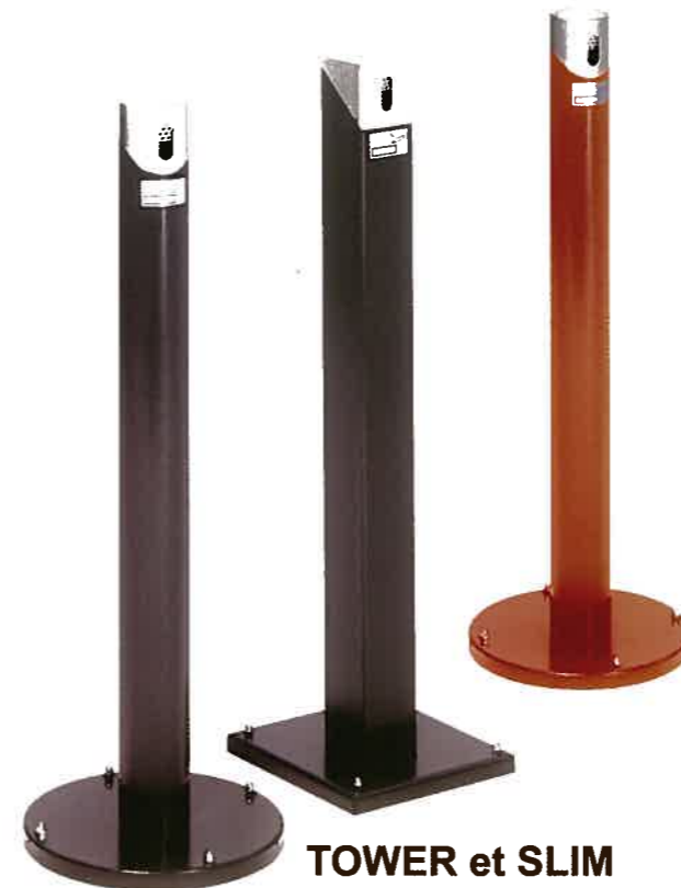
TOWER et SLIM

Slim : Embase Ø 36 cm Ht : 100 cm Tower : Embase 30 x 30 cm Ht : 100 cm