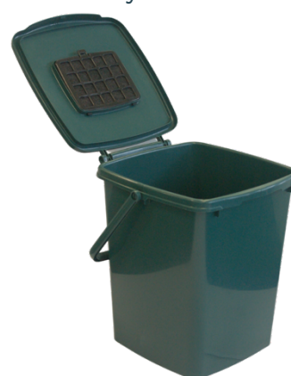
10L VENTILÉ + FILTRE